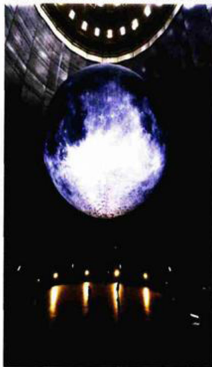
Fotografija iz izlaganja Wolfganga Eberta, ERIH

kojeg zovemo "direktan kontakt s mušterijom" - možemo poručiti tim ljudima da "postoje i druge lokacije koje bi vas možda zanimale". Radi se o ogromnom oglašivačkom potencijalu. Trenutačno objekte industrijske baštine samo u pokrajini RUHR (Njemačka) posjećuje preko 10 milijuna ljudi godišnje.